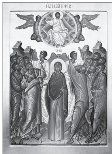
Вознесение Господне. Сийская иконописная мастерская.