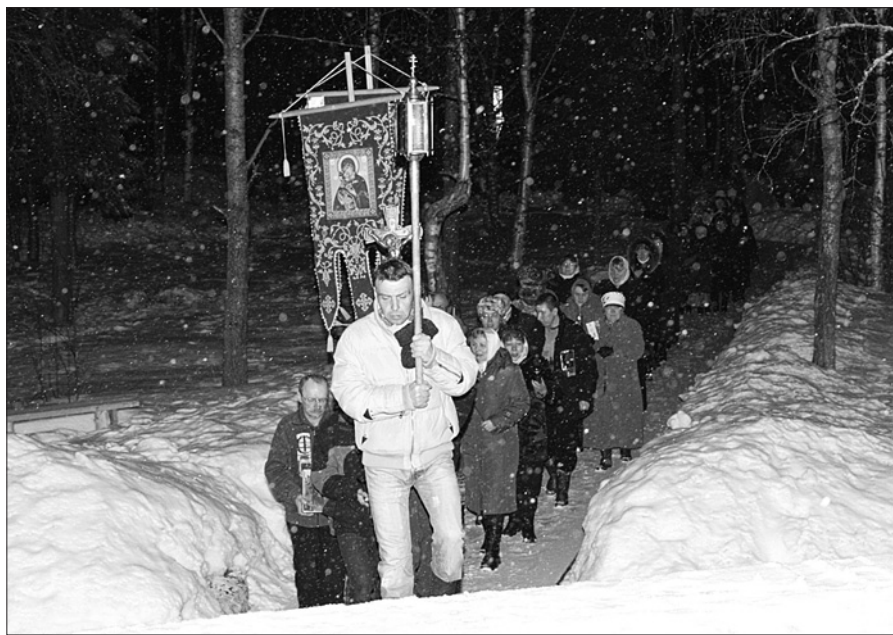
Мезень. Крестный ход.

тил здесь Мезенский лесозавод. С марта завод возобновил свою работу. Часовенка построена недавно, она невелика, но уютна. На первой Литургии присутствовало 20 богомольцев, из них 10 причастилось.