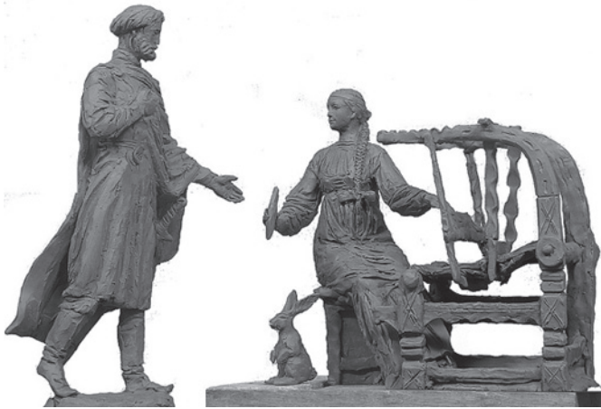
Вариант проекта памятника.